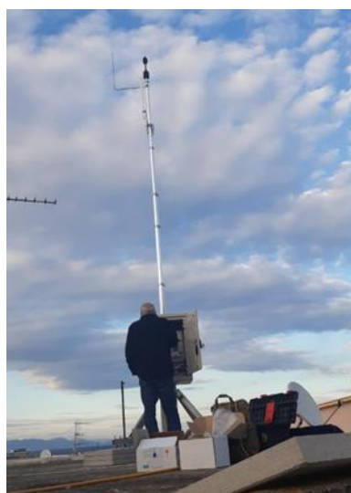
Εικόνα 10: Σταθμός παρακολούθησης θορύβου (MP01) στη Ρόδο.