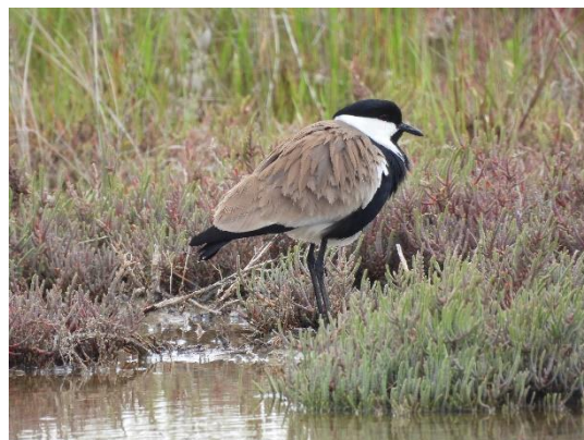
Εικόνα 4: Αγκαθοκαλημάνα