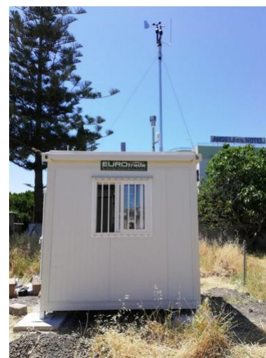
Εικόνα 6: Μόνιμος σταθμός μέτρησης