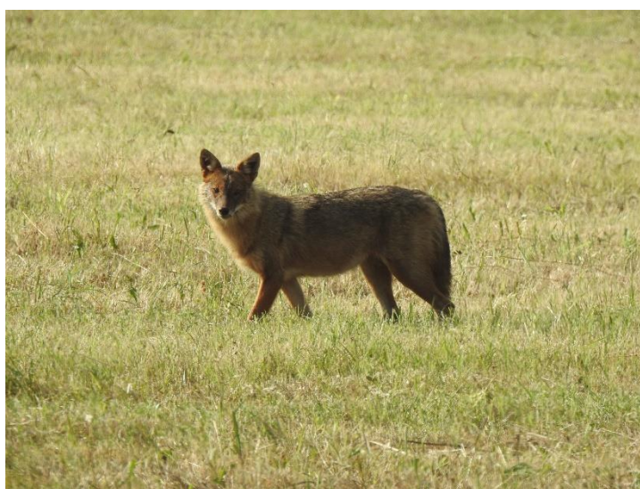
Εικόνα 5: Χρυσό Τσάκαλο

Λεπτομερής αναφορά των δράσεων για την επίτευξη των παραπάνω στόχων περιλαμβάνεται στο Πρόγραμμα Προστασίας της Βιοποικιλότητας.