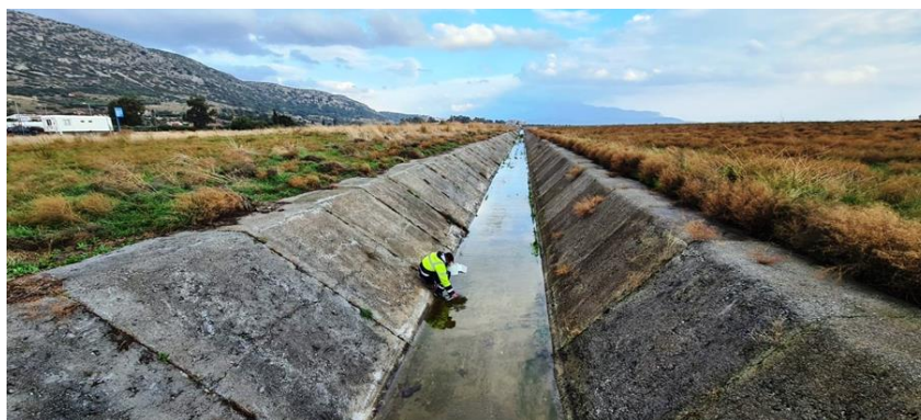
Εικόνα 2: SMI δειγματοληψία επιφανειακών απορροών από τάφρο ομβρίων.