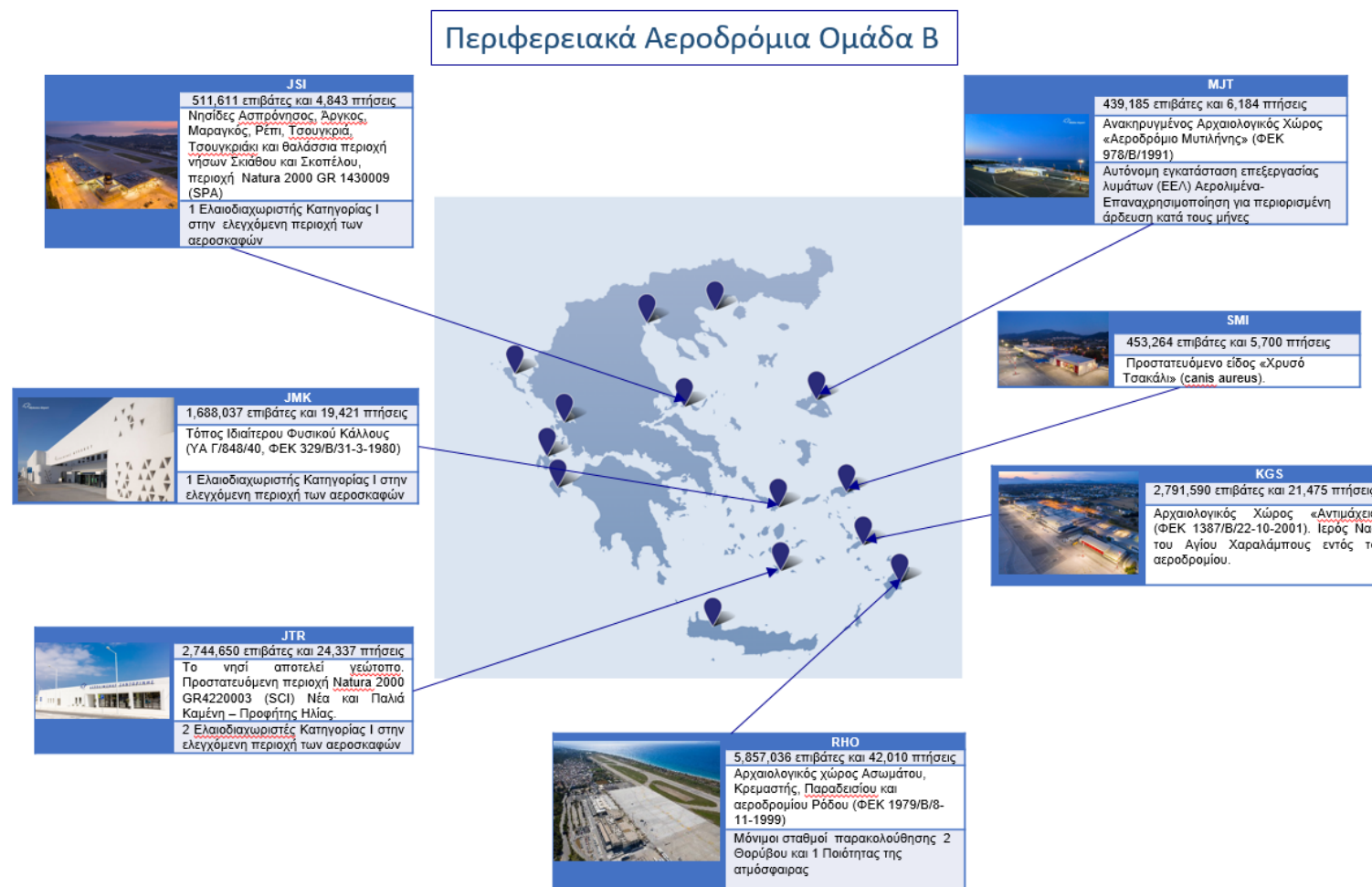
Εικόνα 1: Fraport Greece Περιφερειακά Αεροδρόμια Cluster Β