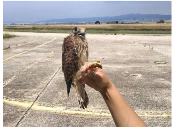
Εικόνα 5: Δακτυλιωμένο Βραχοκιρκίνεζο στον αερολιμένα Θεσσαλονίκης