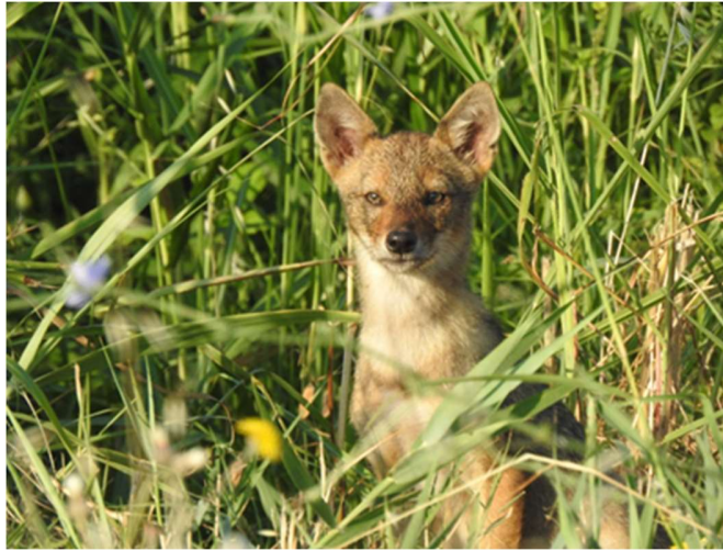
Εικόνα 6: Χρυσό Τσακάλι στον αερολιμένα Καβάλας