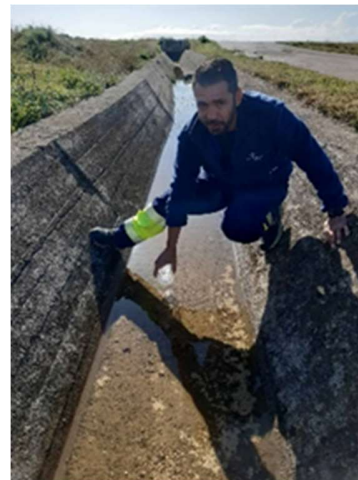
Εικόνα 3: EFL δειγματοληψία επιφανειακών απορροών από τάφρο ομβρίων