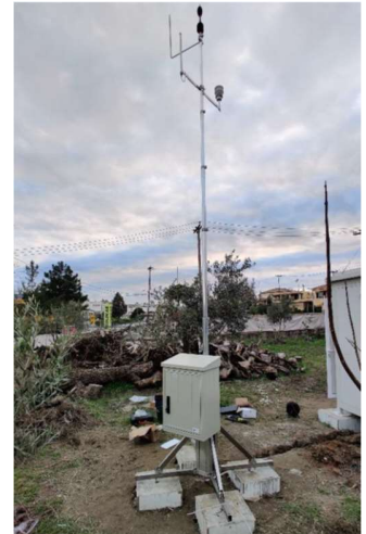
Εικόνα 8: Σταθμός παρακολούθησης θορύβου στον αερολιμένα Κέρκυρας (CFU) (MP01)