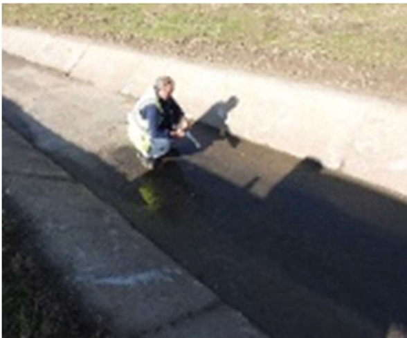
Εικόνα 2: ΚVA δειγματοληψία επιφανειακών απορροών από τάφρο ομβρίων