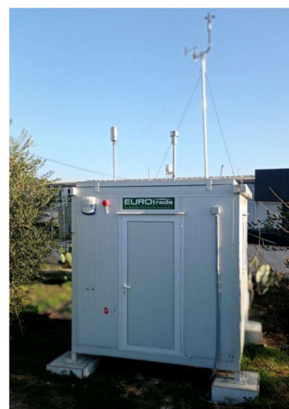
Εικόνα 7: Μόνιμος σταθμός μέτρησης